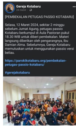
Gambar 6 Akun Facebook Gereja Kotabaru