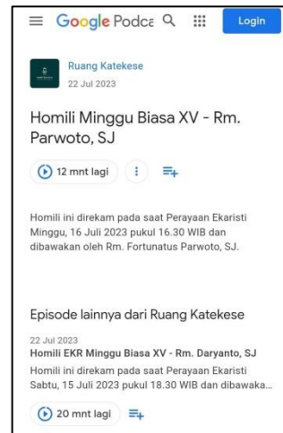
Gambar 8 Ruang Katekese Gereja Kotabaru