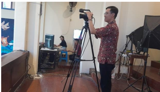
Gambar 3 KDS melakukan siaran langsung Misa Minggu Palma

dokumentasi, serta divisi multimedia and asset management. Masa periode kepengurusan kedepannya berlangsung selama 2 hingga 3 tahun. Selain itu, pengelolaan media komunikasi yang digunakan sudah menggunakan sosial media yaitu Instagram, Youtube, Tiktok, X, Website, Ruang Katekese, dan Facebook.