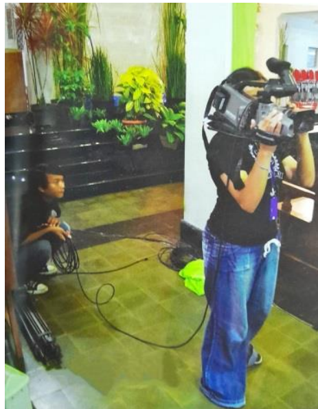
Gambar 2 Tim Patemon sedang melakukan dokumentasi

Pada salah satu misi Gereja Santo Antonius Padua Kotabaru Yogyakarta tahun 2011 yang mempersiapkan diri menuju usianya ke 100 tahun maka lebih berfokus pada menumbuhkan iman di kalangan kaum muda dalam menggereja. Pada usianya yang sudah menginjak 85 tahun diketahui bahwa adanya tim Patemon (paguyuban dan monitor) yang berkecimpung dalam pelayanan pada media dokumentasi Gereja. Selain itu, penggunaan media sosial Facebook sudah mulai digunakan untuk mendukung pelayanan kepada umat. Ketika itu masih dikelola oleh Sekretariat Paroki, tetapi adanya krisis kebutuhan akan penyampaian informasi yang rutin sehingga diperlukan adanya relawan maupun relawati untuk mengunggah informasi (P. Mutiara Andalas et al., 2011).