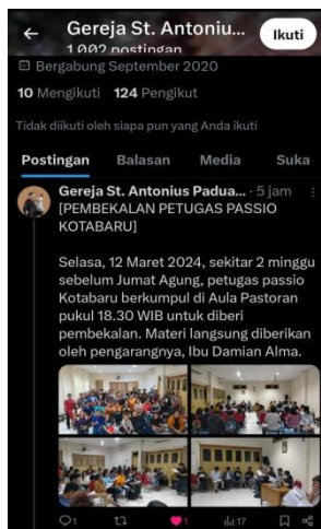
Gambar 7 Akun X Gereja St. Antonius Padua Kotabaru