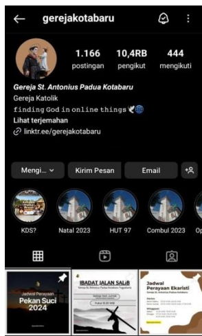
Gambar 5 Akun Instagram @gerejakotabaru

Mengunggah sebuah konten serta komunikasi yang dilakukan pada akun yang dikelola KDS merupakan tugas dari divisi publikasi dan komunikasi. Akun yang dikelola yaitu Instagram, Facebook, X, Ruang Katekese, Website, dan Tiktok.