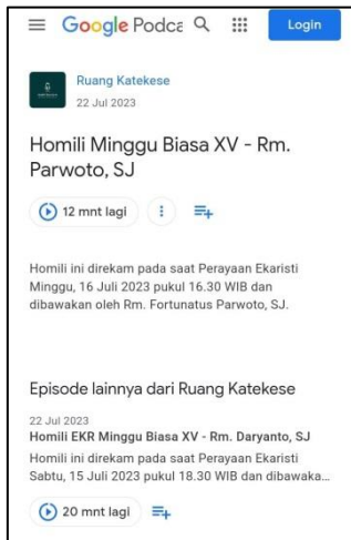
Gambar 9 Ruang Katekese Gereja Kotabaru