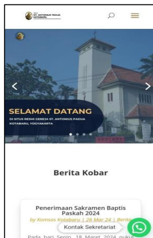
Gambar 11 Website Gereja Kotabaru

Eksistensi dari Gereja Kotabaru memberikan kemudahan pada publikasi konten-konten media sosial yang diunggah dalam beberapa platform tersebut. Hal ini pula yang menjadikan awareness atau kesadaran dalam semua unggahannya dapat menjadi patokan bagi banyak kalangan untuk mendapatkan sumber informasi.