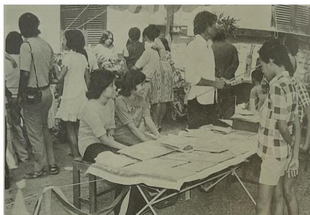
Gambar 1 Foto Muda Katolik tahun 1968

Muda Katolik Indonesia pertama kali menggunakan media massa dalam ikut andil menggunakan teknologi yang ada pada saat itu dengan menerbitkan sebuah majalah yang diberi nama Kejora di mana masih berbentuk stensilan. Majalah ini hanya bertahan sebentar karena kurang berkembang. Kemudian bertepatan pada awal tahun ini IPPI atau Ikatan Pemuda Pelajar Indonesia menyelenggarakan Musyawarah Besar Demoralisasi Pelajar sehingga MKI merasa terpanggil untuk berpartisipasi menanggulangi krisis tersebut. Kedua kalinya menerbitkan sebuah majalah yang dilatarbelakangi sensasi atas dasar semangat muda, maka majalah ini dinamakan Sensasi. Pertama kali diterbitkan pada 1 Juli 1955, lalu semakin berkembang dengan sudah berbentuk stensilan setengah folio yang mendapatkan bantuan dari Departemen Kesehatan RI. Kantor ini bersedia meminjamkan mesin stensil untuk proses pembuatan majalah tersebut. Akan tetapi, nama Sensasi dipandang kurang tepat oleh beberapa Rama, maka namanya diubah menjadi majalah Spirit. Kemudian Paroki Kotabaru sudah memiliki majalah bulanan yang disebut Gema yang terbit sejak Juli 1974. Media komunikasi ini yang menjadi penyalur warta kegiatan paroki/kring (Moedjanto et al., 1976). Terakhir diketahui oleh Sekretariat Paroki bahwa majalah ini terbit hingga tahun 1990an.